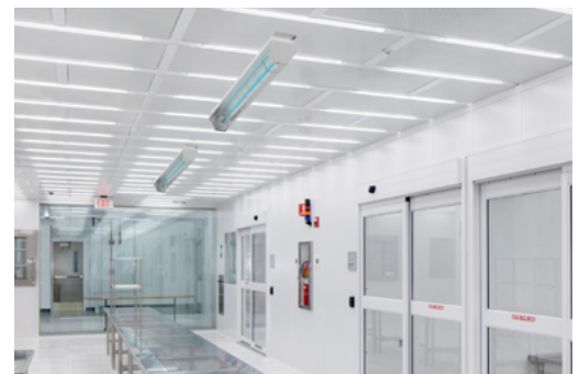
Applicazione in un ambiente industriale

La tecnologia UV-C è un metodo di disinfezione fisico con un ottimo rapporto costi/benefici, è ecologico e, al contrario degli agenti chimici, funziona contro tutti i microrganismi senza creare resistenze.